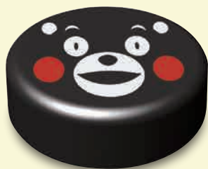
熊本県キャラクター