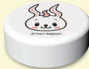
別府市キャラクター